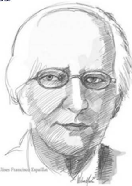
Ulises Francisco Espaillat

“La moral es la base más firme de los pueblos libres” -Francisco Ulises Espaillat-