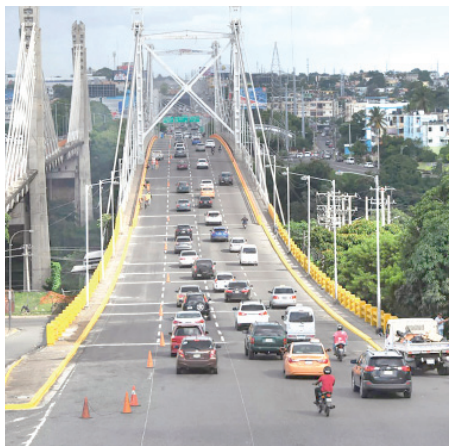
El puente Duarte fue remozado. F.E.

Dijo que se entrega toda una infraestructura remozada con el mantenimiento debido a que va a contribuir no solamente a la agilización del tráfico en estas vías, sino también a garantizar y extender la vida útil de una de las principales infraestructuras viales de la República Dominicana. ● elCaribe