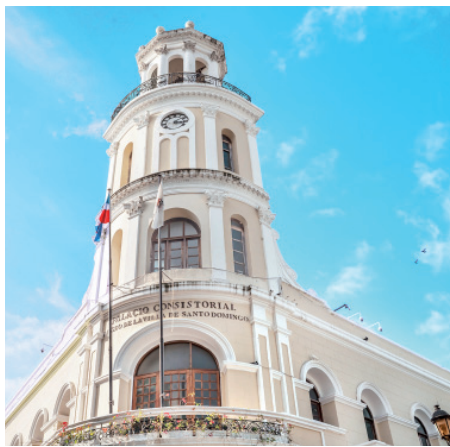
Alcaldía del DN coordina encuentros. F.E.

Se espera que cada delegación no solo pueda compartir sus logros, sino también, nutrirse de las experiencias de las demás ciudades, así como consensuar una perspectiva y una línea de acción regional de cara al siguiente período. Dichos encuentros serán llevados a cabo en el Ministerio de Relaciones Exteriores. ● elCaribe