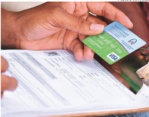
El gasto social fue de RD$310 mil millones en 2018.